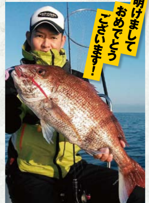
今年もテイルウォーク10周年です。魚もバシバシ釣りたいですし、皆さんに「キターっ!」と思って頂けるような製品をお届けできたらなあと思います

2016年の新製品が続々。専用ロッドとクロズドフェイスリールがセットになったキャンピーはC50L-Pi、C56L-Reの2モデル、クロシオのハイギアモデルは33HGX、43HGX、53HGX、63HGXの4モデルをリリース。毎年恒例の新製品を発表する東京、大阪の業者さん向けのイベント展示会&受注会「ニューコレクション・エキシビジョン・オーダーズネオ2016」を皮切りに名古屋ルアーフェスティバル「キープキャスト」や地方展示会などイベントが続きます。今年も感謝の意味を込めてプレゼントや小ネタを用意し、各地を巡ろうと思っています。新製品は先にご紹介した通りですが、テイルウォークファンの皆さんがムラムラするような10th ANNIVERSARY限定モデルにご期待下さい。今年も1~6月の前半は強烈なスケジュールになるかと思いますが、ぜひ応援して下さいませ!