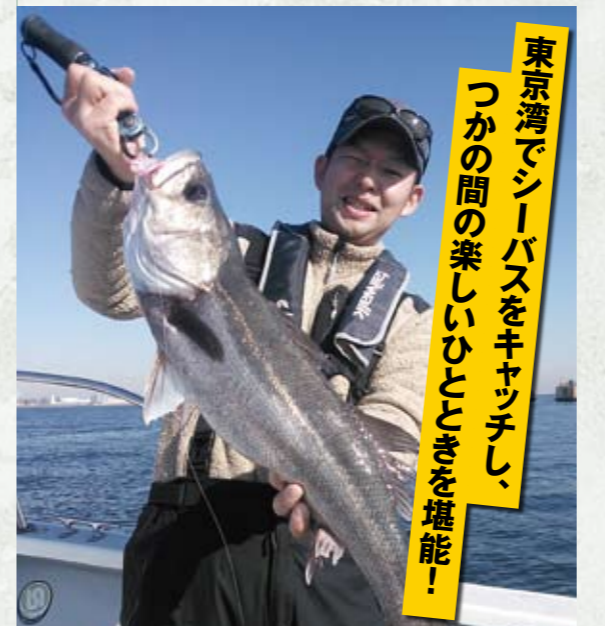
東京湾でシーバスをキャッチし、つかの間の楽しいひとときを堪能!

を残り、アオリイカに違和感を抱かせにくいようなフイーリングを狙いました。 このしなやかさは、波やウネリによる餌木の余計な動きを吸収するので、不自然な印象を与えません。スレたイカたちを違和感なく誘うことでしょう。 TIPBANG TZを使うときに注意点が一つあります。高弾性で細身のブランクを採用し、パワー伝達が速いため「ガシガシ」しゃくらなくても、「少しのパワー入力」で餌木が動きまわります。ですから「フワフワ」としゃくりましょう。 それから機能とオリジナリティーを盛り込んだグリップデザインにも注目です。感度を高めたいというコンセプトで、グリップエンドに穴が開いています。以前にご紹介したアジストTZの機構を継承